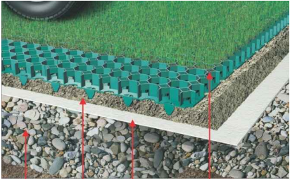
zhutněný štěrk geotextilie GUTTATEX